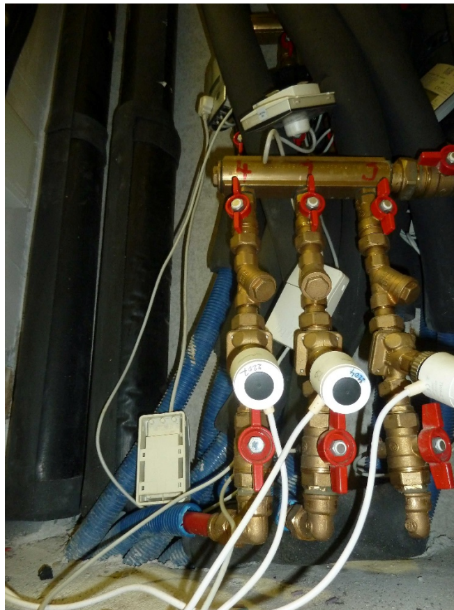
Défauts d'identification compteurs - servomoteurs