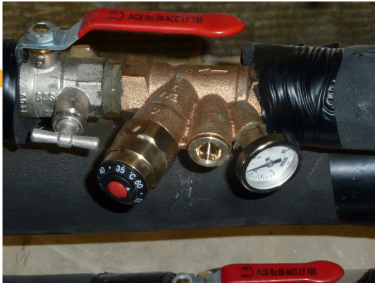
Retour de bouclage à 28°C